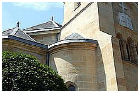
Le temple de la Fondation protestante John Bost à La Force en Dordogne

Lieu de soin, lieu de vie, lieu de sens.