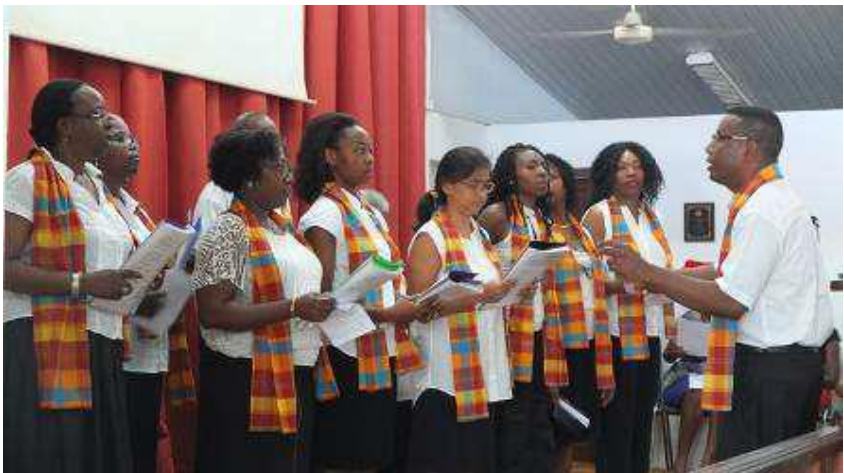
Chorale de l'Eglise protestante de Guyane lors du culte de la Réformation le 25 octobre.