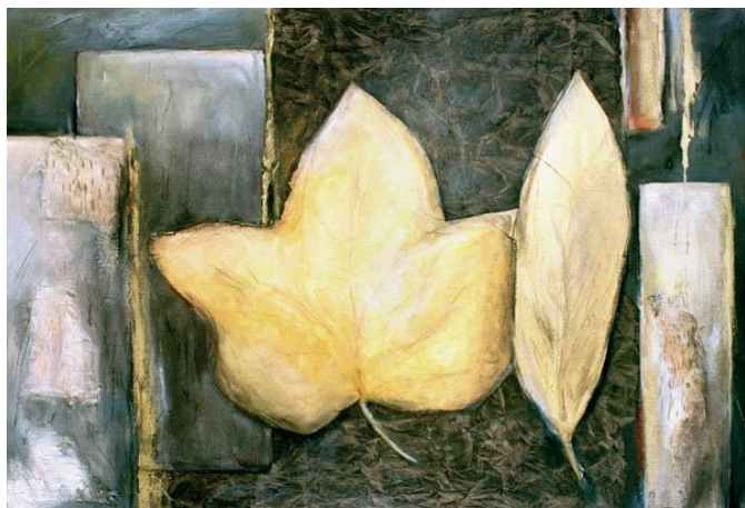
Dagmar Zupan – Composition de feuilles d'automne