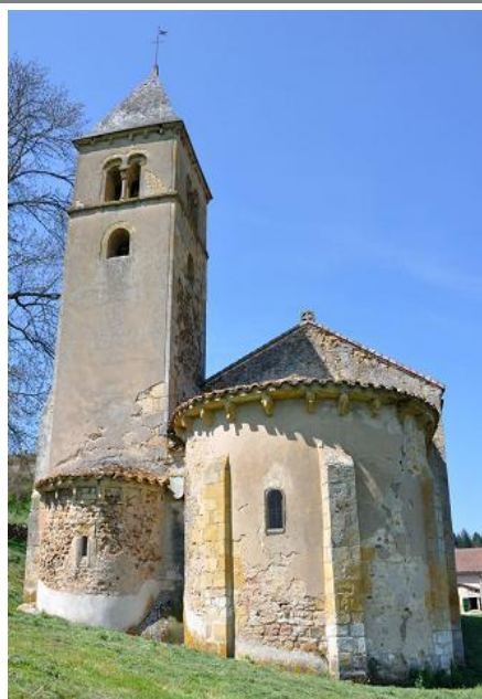
Chapelle romane de St-Martin-la-Vallée (71110)

Ayez du sel en vous-mêmes, et soyez en paix les uns avec les autres.