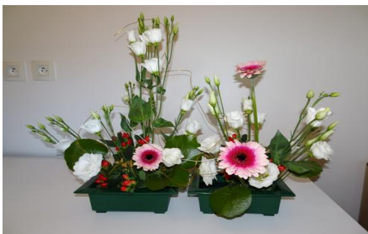
Bouquet réalisé par Simone Bauer lors du dernier cours d'Ikebana.