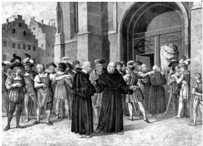
Luther affichant ses thèses sur la porte de l'église de Wittenberg.