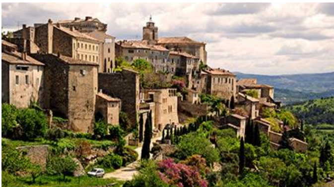
Vue du village de Lourmarin (Luberon)

**Les « barbes » étaient des prédicateurs des communautés du mouvement vaudois (de Pierre Valdo). Ce terme signifiait « oncles » pour les distancier des « pères » catholiques. (Histoire des Vaudois, musée virtuel du protestantisme).