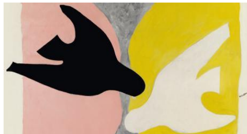
Deux colombes, Georges Braque