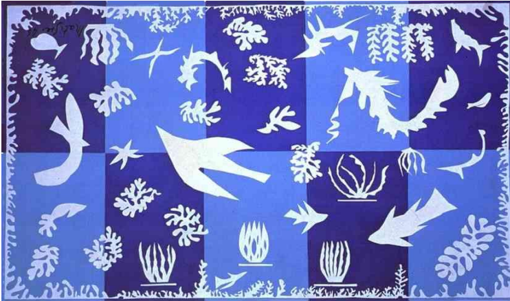
Henri Matisse – Polynésie

Voici mon commandement : Aimez-vous les uns les autres, comme je vous ai aimés.