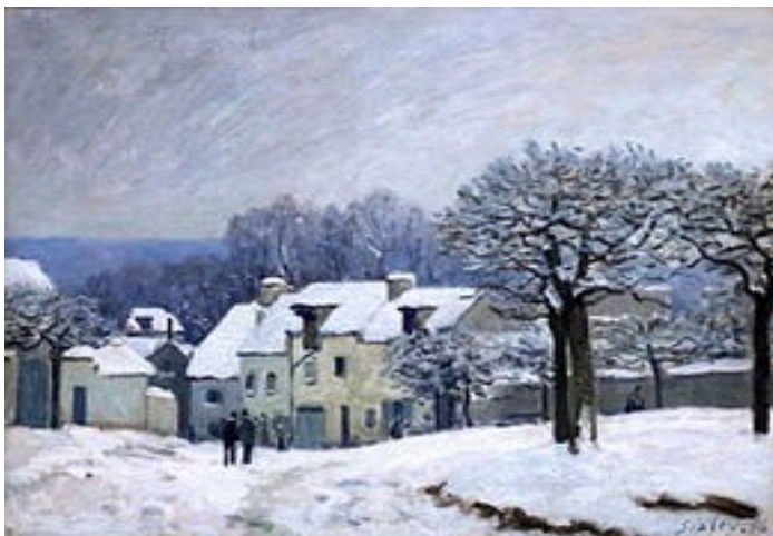
Marly effet de neige, Sisley.

L'herbe sèche, la fleur se fane mais la parole de notre Dieu subsistera éternellement.