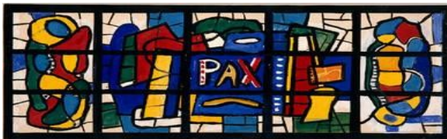
Vitrail de Fernand Léger

Seigneur, Tu m'offres cette nouvelle année comme un vitrail à rassembler avec les 365 morceaux de toutes les couleurs qui représentent les jours de ma vie.