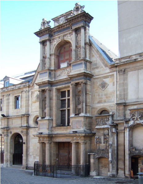
Chapelle Taitbout à Paris

Le XIX e siècle commence avec le Concordat de 1801 et les Articles organiques de 1802 qui réglementent la vie des Églises.